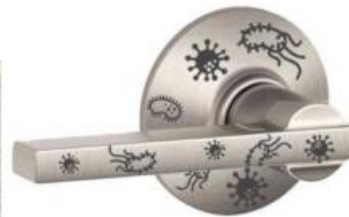
Husk folk på at bruge albuen eller tage fat med rene hænder ved at placere en reminder over stikkontakter, dørhåndtag eller andre steder, hvor mange berører. Usynlige vira og bakterier kan gøres synlige i vores bevidsthed ved at placere ikoner af bakterier på dørhåndtag.