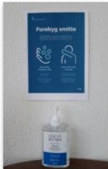
Placer en håndsprit, hvor folk færdes, fx ved indgangspartier, ved buffet og ved indgangen til toiletter. Gør den synlig med et skilt.