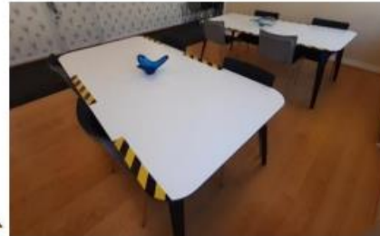
Stribet eller rød tape kan signalere advarsel eller forbudt. Brug rød eller stribet tape, hvis du vil signalere, at man ikke skal stå eller sidde et bestemt sted.